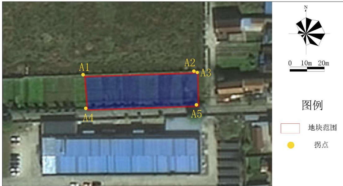
图 1.1-3 地块调查范围拐点图