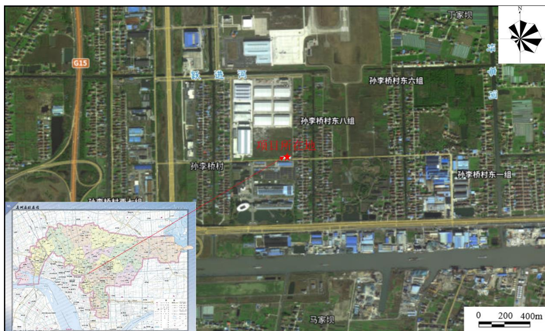
图 1.1-1 地块具体位置图

本次调查地块为通州区兴东街道孙李桥村卫生室新建工程地块，位于南通市通州区兴东街道孙李桥村，地块具体位置见图 1.1-1，地块红线图见图 1.1-2，地块调查范围拐点图见图 1.1-3，具体拐点坐标见表 1.1-1。