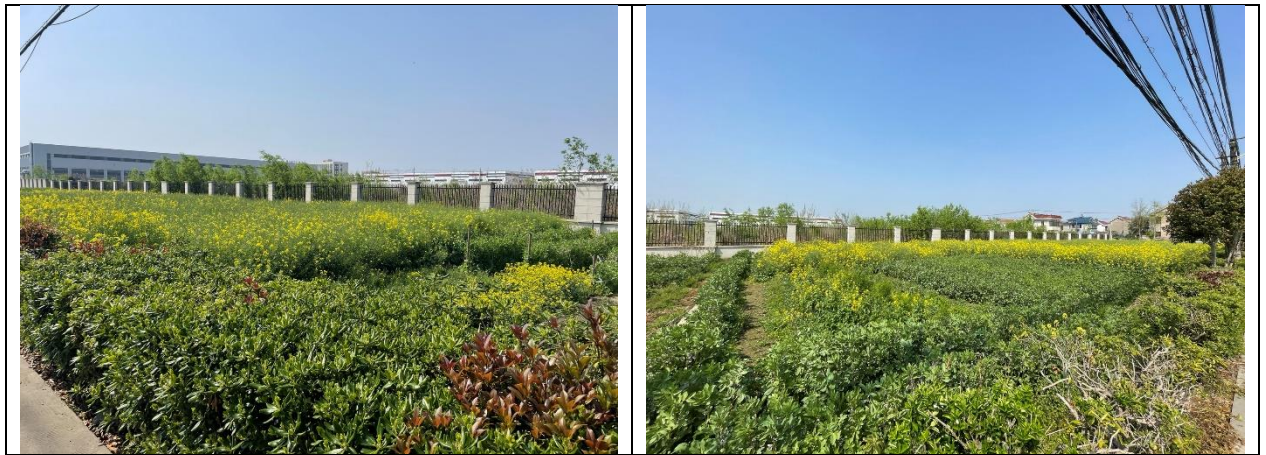
图 1.3-1 调查地块现场踏勘图